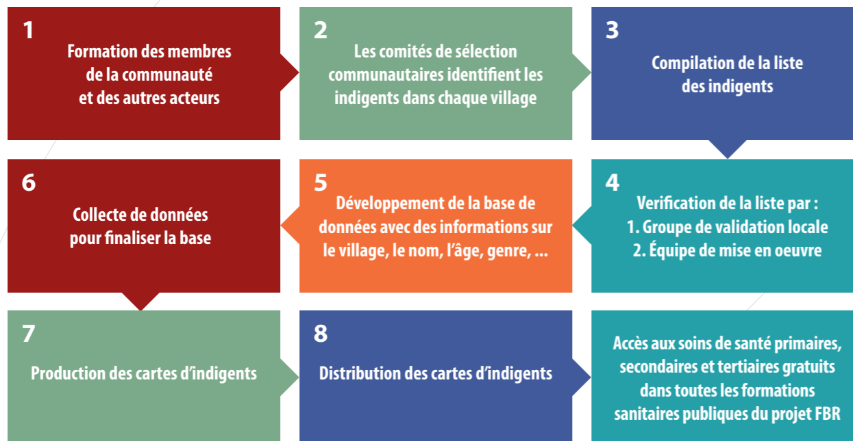
Figure 1 : Le ciblage communautaire au Burkina Faso

La sélection et l'identification des indigents s'est déroulée de mai 2014 à janvier 2016. Le processus est décrit à la figure 1. Dans les huit districts (Diébougou, Batié, Kongoussi, Kaya, Ouargaye, Tenkodogo, Gourcy, Ouahigouya), elle a couvert 1 745 789 personnes, soit environ 10% de la population totale du pays. 1 172 comités de sélection communautaires ont sélectionné les indigents sur la base de leur connaissance approfondie de la population. En moyenne, 6 % de la population totale (102 609 personnes) a été identifiée comme indigents par la communauté, bien que 15 à 20 % ait été envisagée (Figure 2).