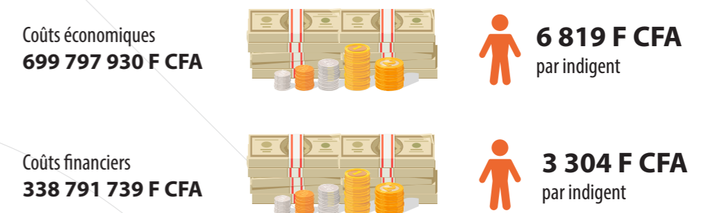
Figure 3: coûts financiers et économiques de la sélection communautaire

Les 3.304 F CFA pour chaque indigent sélectionné équivalent à 21% des dépenses de santé du gouvernement du Burkina Faso par habitant.